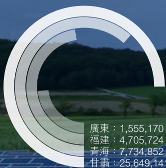
四個發電站 2013 年售電量（度）

截止 2013 年 12 月 31 日，我們 4 個太陽能發電站總裝機容量為 132.9 兆瓦，分別位於廣東、福建、甘肅和青海。4 個發電站售電量約為 3,964 萬度。